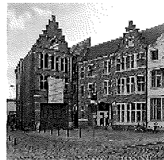
Jeugdherberg De Draecke